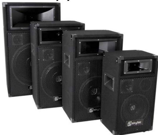
SM8 (170.761) 8" SM10 (170.764) 10"