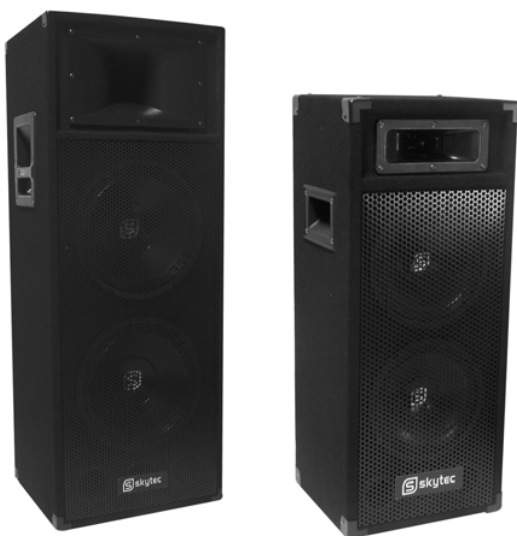
SM28 (170.746) 2x 8" SM210 (170.748) 2x 10"