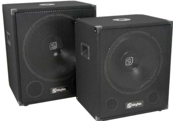
SMW15 (170.750) 15" Subwoofer